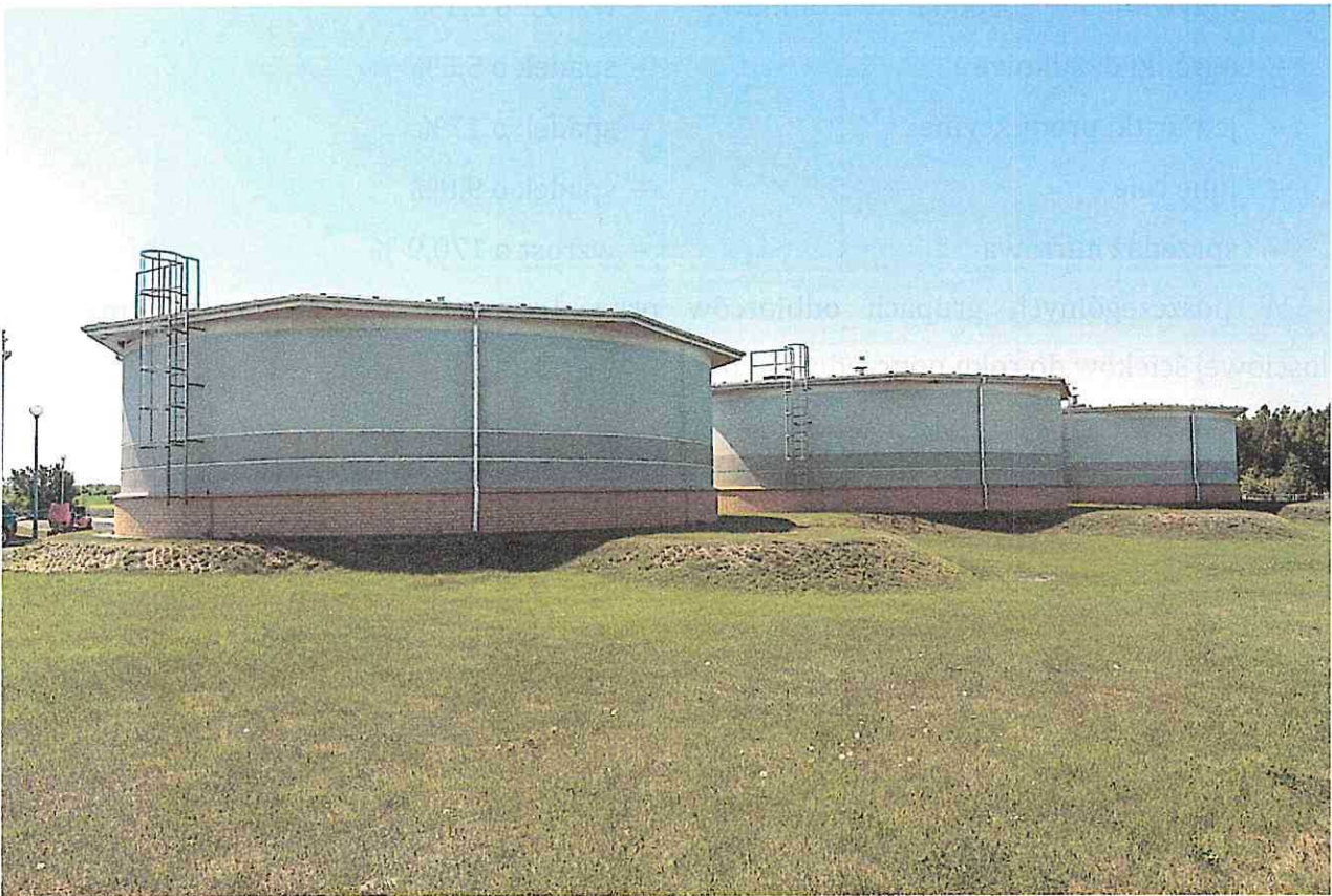
Zbiorniki wody uzdatnionej

Woda podawana ze Stacji Uzdatniania Wody przy ul. Norwida zawiera średnio 0,04 mg/dm 3 związków żelaza na dopuszczalną wartość 0,2 mg/dm 3 ; zaś zawartość manganu wynosi średnio 0,009 mg/dm 3 na dopuszczalną wartość 0,05 mg/dm 3 . Stacja pracowała prawidłowo i bez większych awarii.